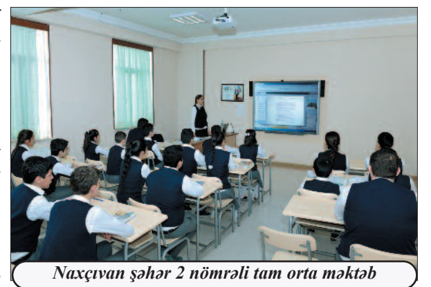
Naxçıvan şəhər 2 nömrəli tam orta məktəb

Dərslərdə vurğulanıb ki, Naxçıvan şəhərində, bütövlükdə, muxtar respublikada iyirmi ildən bəri aparılan