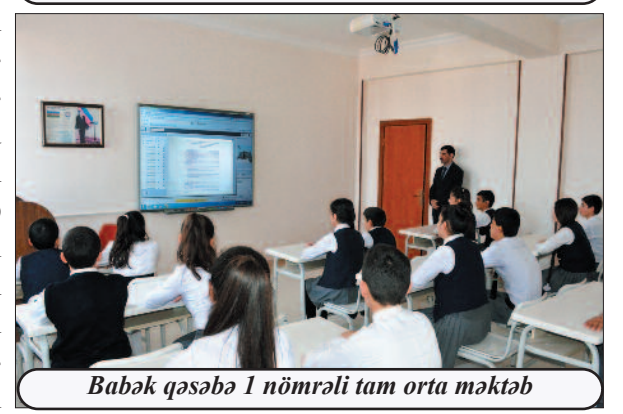
Babək qəsəbə 1 nömrəli tam orta məktəb

məqsədyönlü siyasət, xüsusilə genişmiqyaslı abadlıq və quruculuq işləri, milli və dini dəyərlərə hörmət və ehtiram, yüksək dövlət qayğısı ilə onların qorunması, inkişaf etdirilməsi, Azərbaycan, eyni zamanda İslam mədəniyyətinə mənsub abidələrin bərpası, qorunub saxlanması, bu işlərin yüksək səviyyədə təbliği, beynəlxalq ictimaiyyətə çatdırılması xüsusi rol oynayır. 2018-ci il üçün İslam Mədəniyyətinin Paytaxtı seçilməsi Naxçıvan şəhərinin İslami dəyərlərə və mədəniyyətlərarası dialoqa verdiyi töhfələrə əlaqədardır.